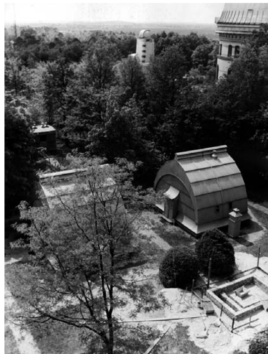
2. ábra A potsdami GeoForschungsZentrum.

sze. A most már potsdami kezdőpontú rendszert 1940-ig egységesítették, és a létrejött rendszer korabeli elnevezése Reichsdreiecksnetz 1940 (RDN-1940) lett. A második világháború során a rendszert a Nagynémet Birodalomba újonnan annektált területeken is bevezették (RMI, 1944). Amint azt a jelen munka során elvégzett, és alább bemutatott számítások igazolják, arra is törekedtek, hogy a rendszert ne csak a német katonai vagy