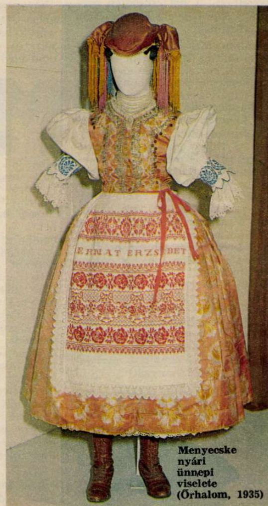
Menyecske nyári ünnepi viselete (Órhalom, 1935)