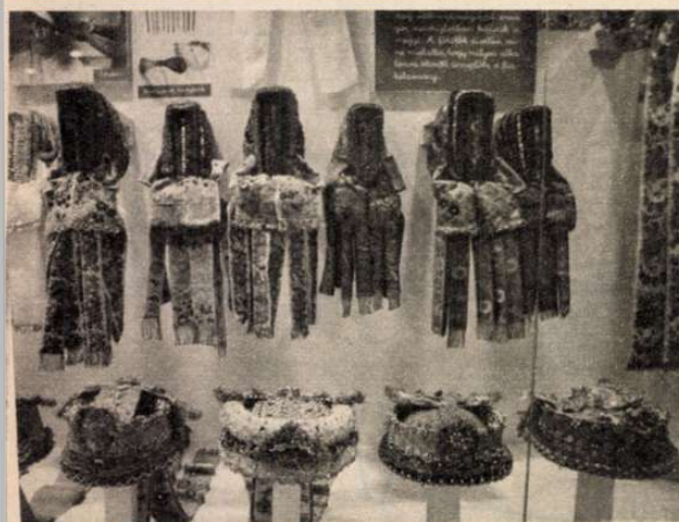
A palóc főkötők tárlója