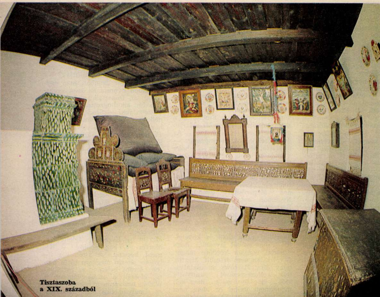
Tisztaszoba a XIX. századból

„A palóc nép babonás, szereti a misztériumokat, hisz az ördögben és a rémlátásokban. Egy sötét holló röpdös fölötte, a végzet. Szárnya suhogását találgatja. Titkos, homályos kód veszi körül, s hova el nem lát a szem, benépesíti a helyeket árnyékkal, borzalmas, csodálatos dolgokkal. Fantasztikus népmesék elhullatott morzsáit összegyűrja, azok hitté keményednek lelkében...”