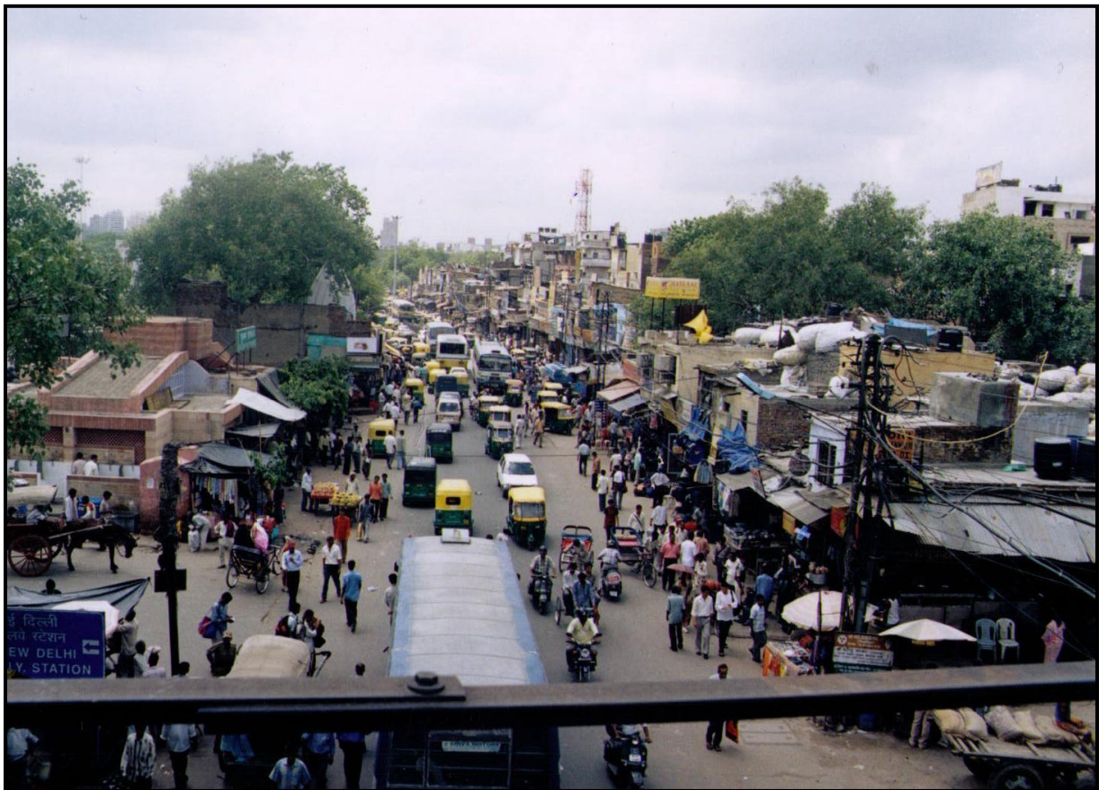
Forgalmi helyzetkép Delhiből