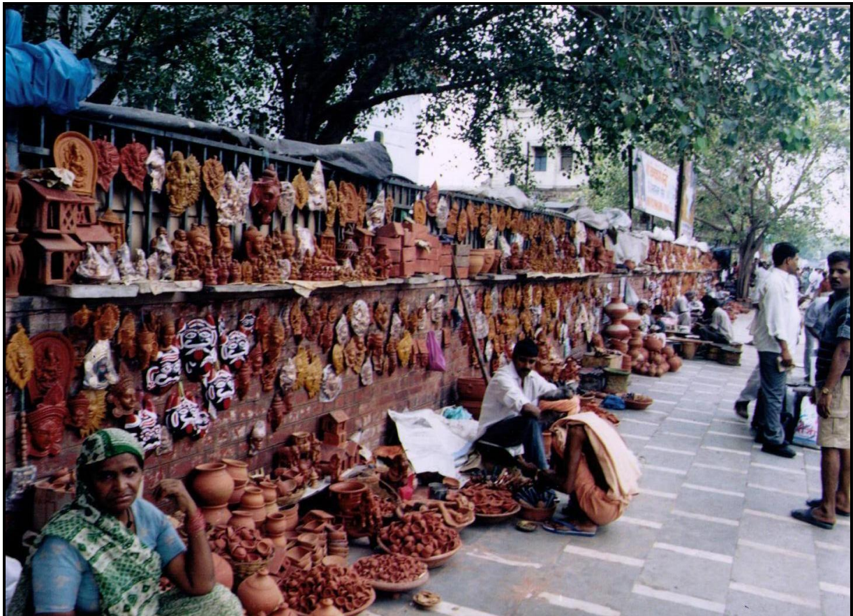
New Delhi pályaudvar közelében az árusok.

A New Delhi pályaudvar előtti hatalmas parkolóban taxik, riksák, árusok és tömeg.