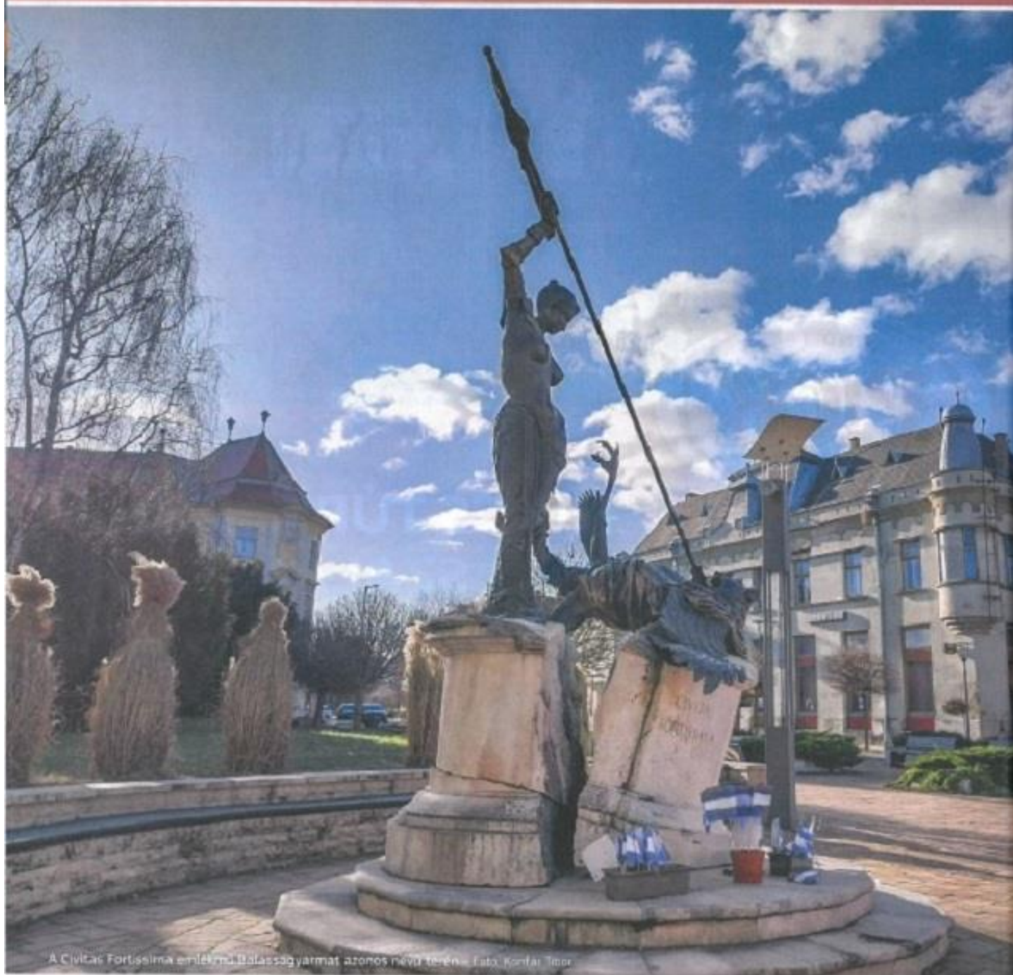
A Civitas Fortissima emlékmű. Bölcsesség yarmat, azonos névű terene.