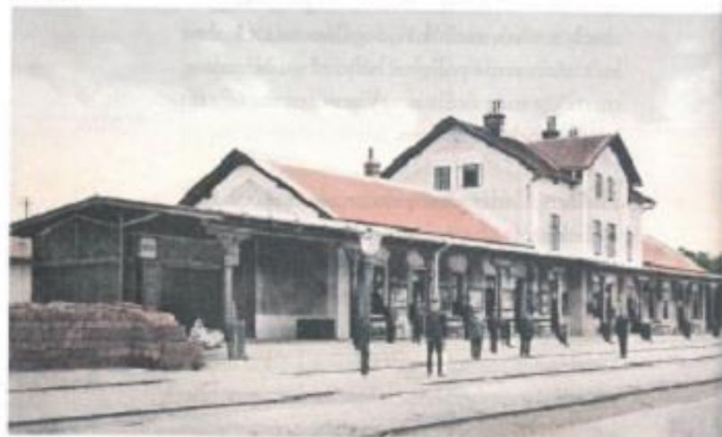
A balassagyarmati vasútállomás épülete az 1910-es években

A támadás így is jól indult, a vasútállomást komoly harcokban el is foglalták a 38-asok, az pedig, hogy a laktanya ekkor még nem került