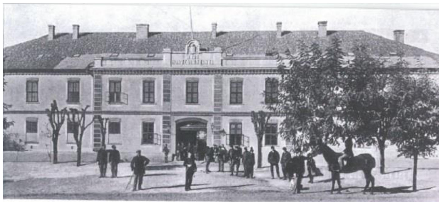
A laktanya épülete egy korabeli képeclapon