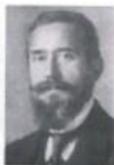
Bazovszky Lajos Archív képek forrása: Madách Imre Városi Könyvtár Helytörténelmi Gyűjteménye

„Isten áldása rajtunk!” volt a titkos jelszó. Aki ezt súgta az embernek mellette elmenőben, az bajtárs volt. „És fiainkon!” volt a köszöntés elfogadási módja. A balassagyarmati polgárok titkos jelszavát a harcok idején a városban megbújó Mollináry Gizella Egy mást vádoltuk című regényéből ismerjük. A jelszó mély hitet, elszántságot és bizakodást sugall, amire óriási szükség volt ezekben a nehéz, történelmi órákban.