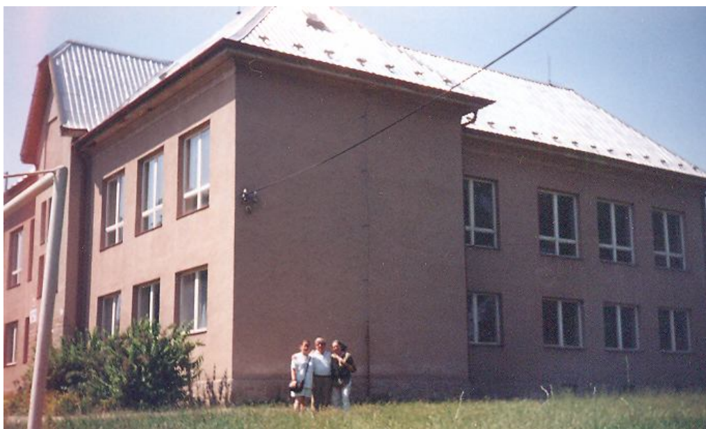
Barsfüssi Elemi Népiskola

Az első bécsi döntés után - mint ahogy ezt az előzőekben jeleztük-, az ifjú házaspár lehetőséget kapott, hogy egyazon iskolába kerüljön. Bars–Hont vármegyébe, Barsfüssre 7 helyezték őket.