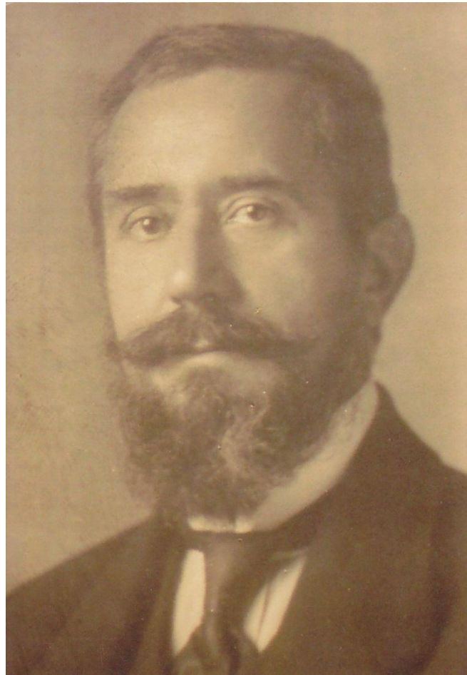
Bazovský Lajos (1872 – 1958)